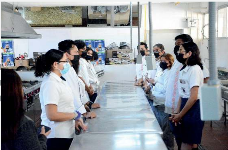
Alumnos de la Escuela de Gastronomía durante el evento.